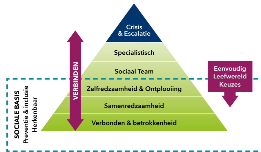
Figuur 1: Samenspel tussen de sociale basis en zwaardere vormen van zorg en ondersteuning