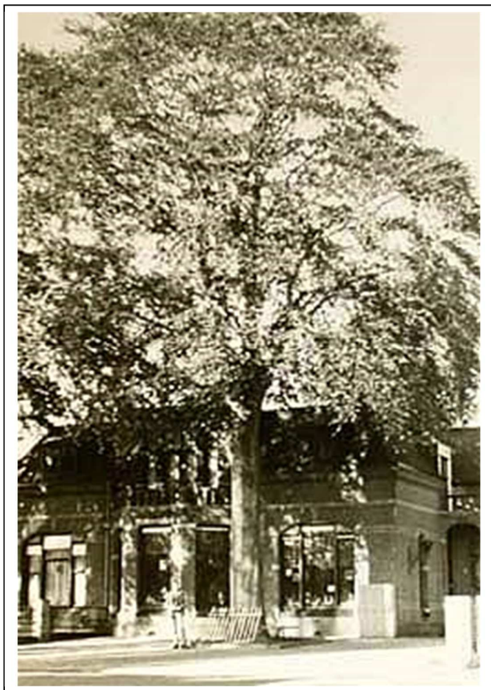
Foto van een oude beuk ( Fagus sylvatica ) in de Wilhelminastraat, opgenomen op de nationale monumentenlijst.

In hoofdstuk 2 wordt het huidige beleid, het doel en de aanpassingen middels deze update beschreven. In hoofdstuk 3 zijn de criteria en de manier van selecteren beschreven. Hoofdstuk 4 geeft een overzicht van de manieren waarop de gemeente Asten de bescherming van deze bomen regelt. In hoofdstuk 5 worden enkele aanbevelingen opgesomd. In de bijlagen worden alle beschermwaardige bomen beschreven en op kaart aangeduid.