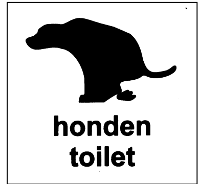
Figuur 1-2: voorbeeld van nieuwe bebording bij hondentoiletten