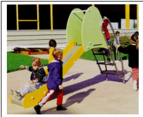
Afb 3. Speelvoorziening voor schoolkinderen van 2 t/m6 jaar met als veilige bereikbare afstand circa 100 meter.