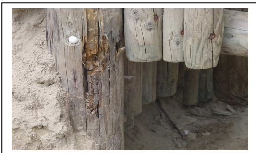
Afb 2. rondhoutspeeltoestel begint reeds na enkele jaren rottingsverschijnselen te vertonen.

In bijlage 4 treft u een opsomming aan van speeltoestellen ouder of gelijk aan 10 jaar die binnen één jaar vervangen zouden moeten worden. Daarnaast zal er jaarlijks geld nodig zijn om de overige rondhoutspeeltoestellen de komende jaren te vervangen door duurzame speeltoestellen, die kwalitatief beter zijn en dus een langere levensduur hebben en minder onderhoud vergen. (zie bijlage 3)