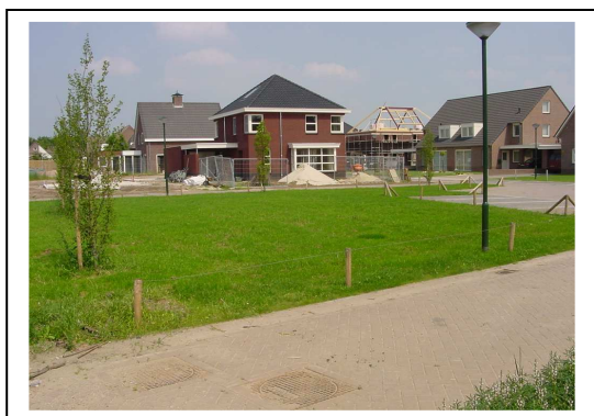
Afb. 8 Nieuw in te richten speelterrein aan Den Wingerd.

Voor een overzicht van geraamde kosten voor inrichting van dit terrein zie par. 6.2.1.