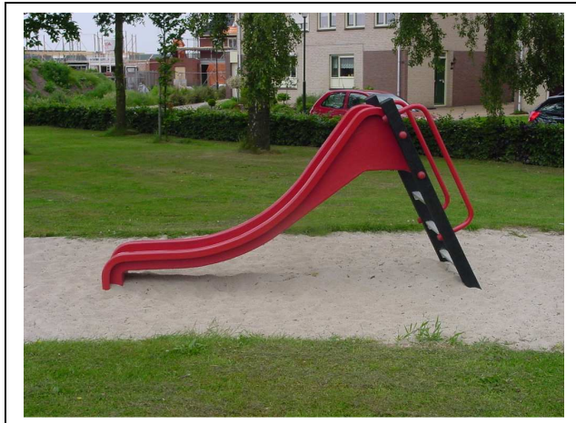
Afb 5. Speeltoestel geplaatst op een geschikte/ veilige ondergrond.