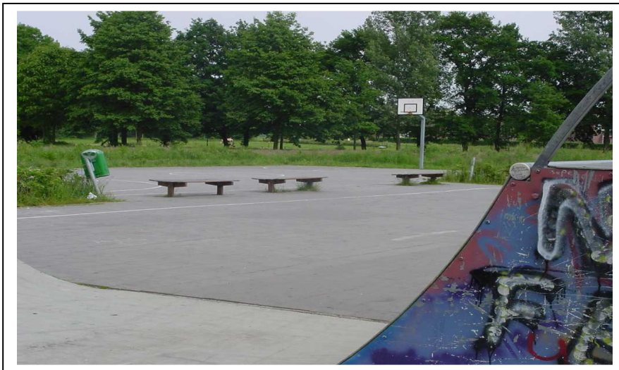
Afb 4. Speelvoorziening aan het Loverveld, tevens ontmoetingsplek voor jongeren.