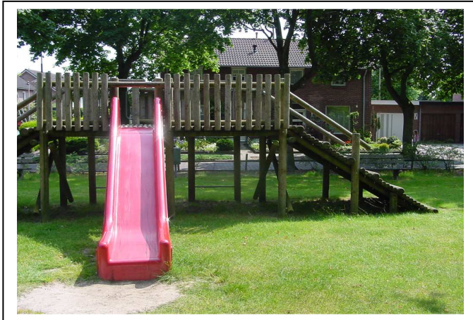
Afb 1. Speeltoestel dat niet voldoet aan de wettelijk verplichte valdempende ondergrond. Dit toestel heeft een valhoogte van > 1,00 mtr. en moet dus voldoen aan een valdempende ondergrond.

De Gemeente Asten is als eigenaar/beheerder verantwoordelijk voor het op orde hebben van valdempende ondergronden op openbare speelterreinen. Wordt hier niet aan voldaan en een gebruiker houdt hierdoor lichamelijk letsel aan over, dan is de Gemeente Asten aansprakelijk. Afgezien van het leed dat e.e.a. kan veroorzaken kan dit de Gemeente veel geld kosten. Aan de hand van een waargebeurd ongeval wordt dit duidelijk gemaakt in bijlage 8. In dit speelruimteplan wordt weergegeven wat het aanbrengen van ondergronden kost en voor welke ondergronden op welke plaats gekozen zal worden.