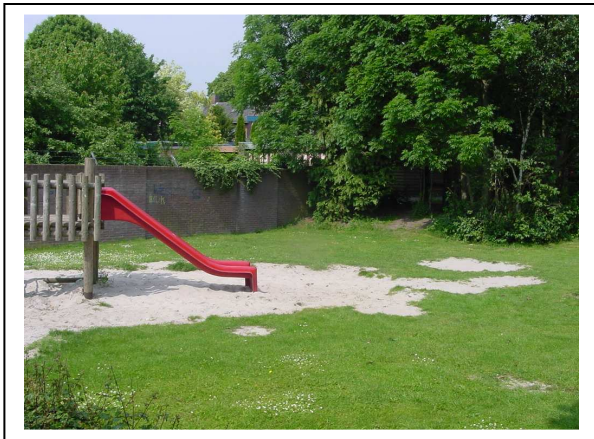
Afb 6. Valdempende zandondergrond zonder opsluiting van opsluitbanden. Duidelijk is te zien dat er veel uitloop van zand is.