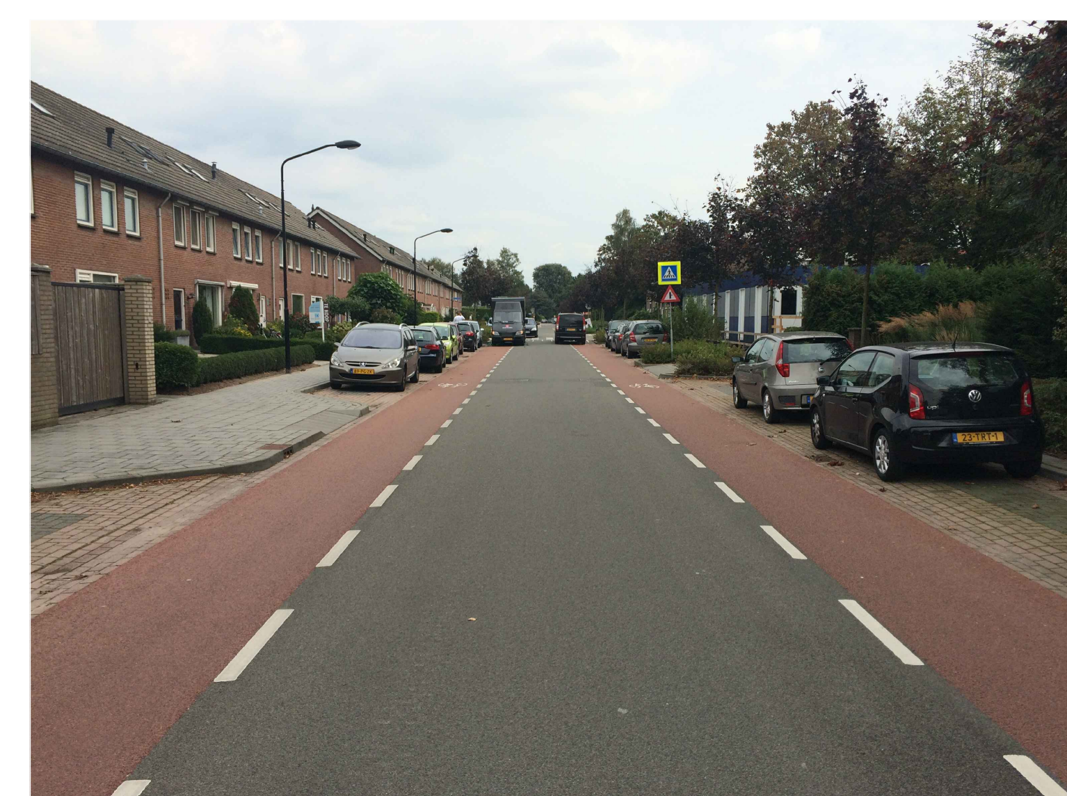
Indicatie nieuwe situatie