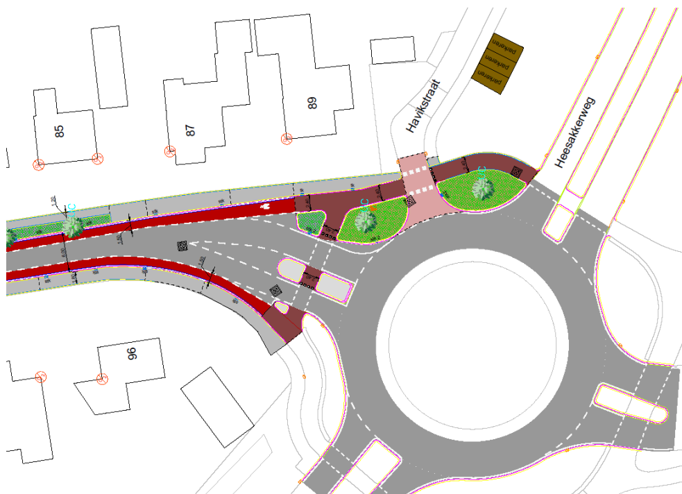
Afbeelding 2. Drie extra parkeervakken naast de grondwal in de Havikstraat.